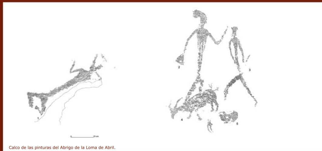
Calco de las pinturas del Abrigo de la Loma de Abril.