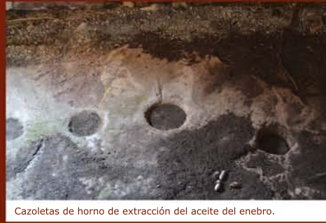
Cazoletas de horno de extracción del aceite del enebro.

El presente itinerario recorre la partida de las Lomas de Abril, un enclave del Rodeno valenciano en la comarca del Rincón de Ademuz, dentro del término municipal de Castielfabib. En este lugar se pueden hallar zonas de gran valor ecológico y medioambiental así como muestras de etnografía de oficios relacionados con la montaña, por otro lado también son interesantes las muestras de arquitectura vernácula vinculada con las diversas construcciones agropecuarias tradicionales de piedra en seco o yeso. No obstante el elemento de más valor que hallamos en esta ruta son las pinturas rupestres que se hallan en el abrigo denominado "Lomas de Abril".