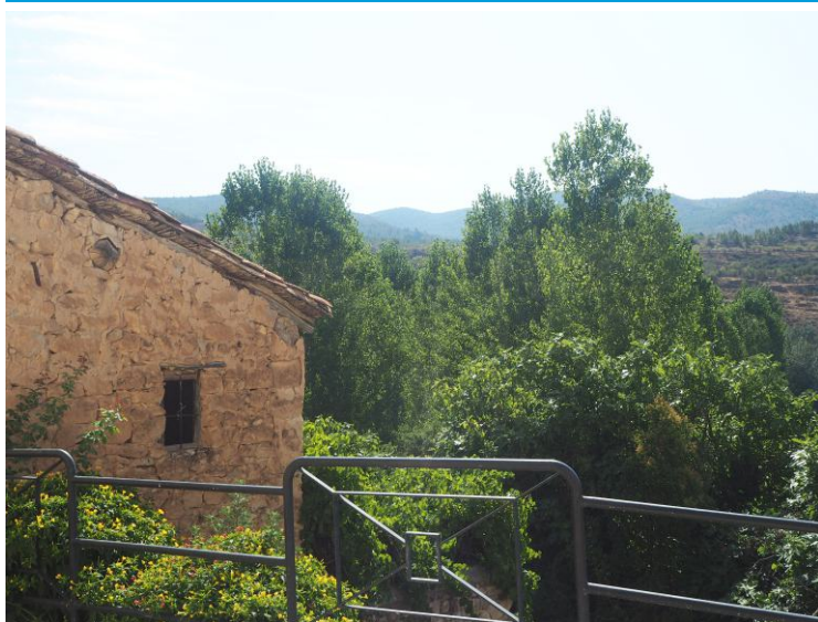
R2. RUTA DEL TURIA