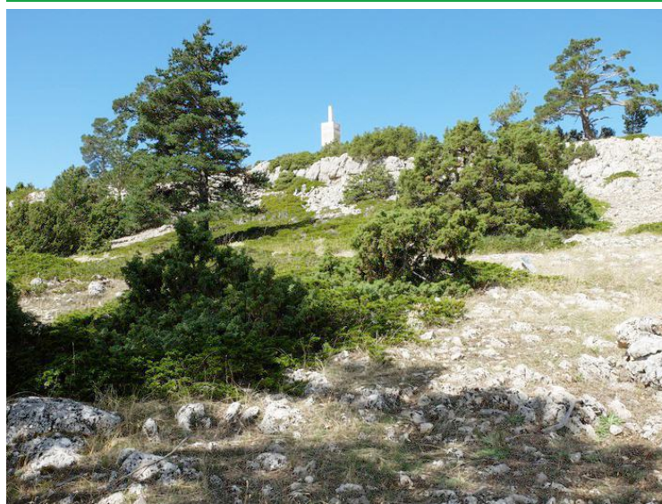
R1. RUTA DEL ALTO DE LAS BARRACAS