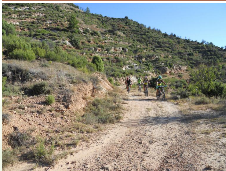
R4. RUTA DE LA LOMA ROMANCE