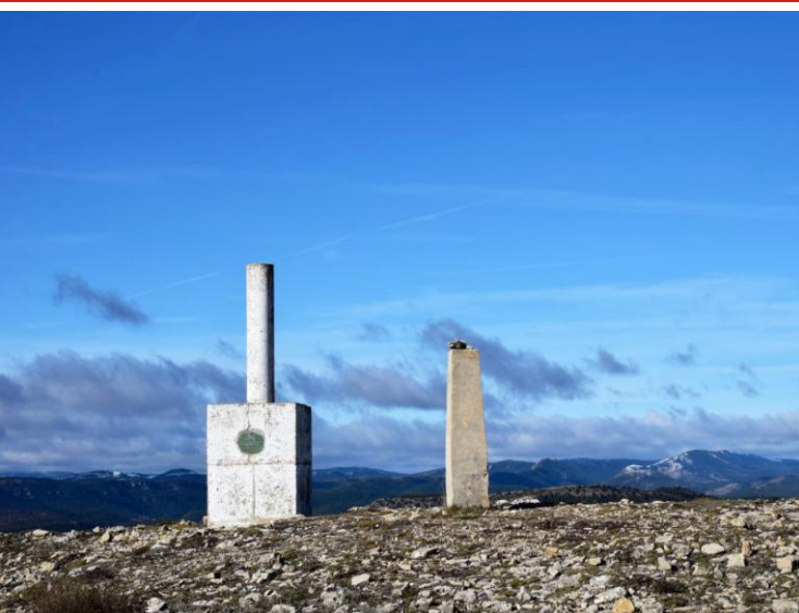
R3. RUTA DE LA CRUZ DE LOS TRES REINOS