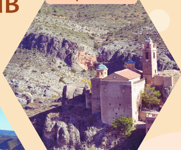
RECINTO AMURALLADO Ruta patrimonial