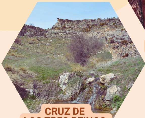
CRUZ DE LOS TRES REINOS Paraje Natural Municipal